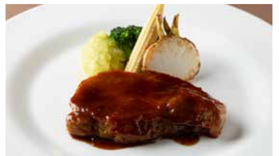
道産豚ロースのソテー、ガーリック醤油ソース