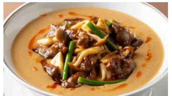
牛肉入りタンタン麺