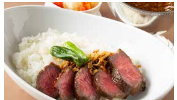
道産牛ステーキ、スパイシーオニオンカレー