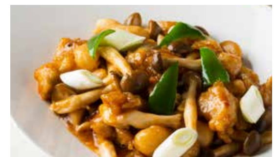
鶏肉のオイスターソース炒め (ライス・ザーサイ付)