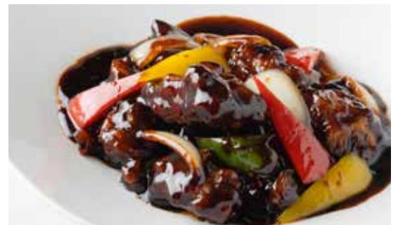
黒酢の酢豚 (ライス・ザーサイ付)