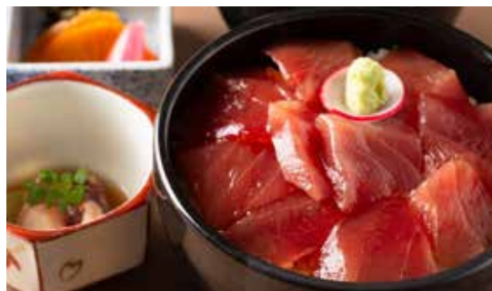
鉄火丼 (小鉢・香の物・味噌汁付)