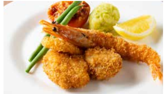
ミックスシーフードフライ (ライス付)