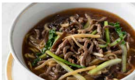
牛肉細切りスープそば (醤油味)