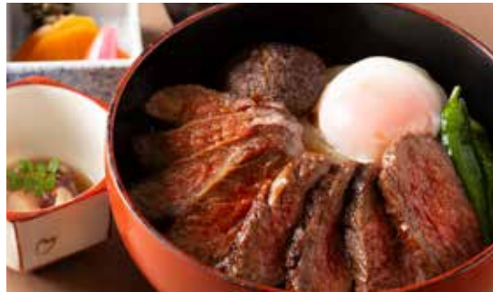
道産牛ステーキ丼 (小鉢・香の物・味噌汁付)