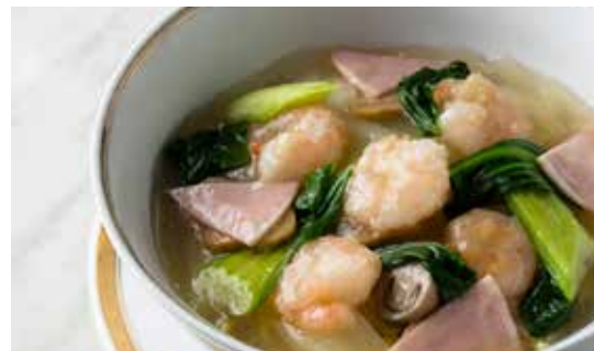
海老入り野菜スープそば (塩味)