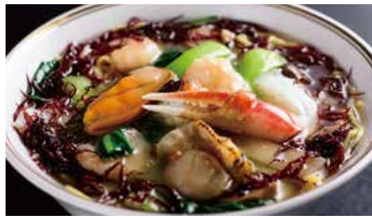
海の幸入りスープそば